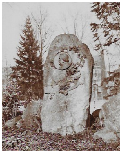
Figure 3 : le monument à Kirschleger à Munster.

Le statuaire nancéien Ernest Bussière, membre de l' Ecole de Nancy , est choisi pour sculpter le médaillon. Son nom et la date "1911" y figurent à côté du visage de Brunotte. La pierre, en grès des Vosges, provient des escarpements voisins et rappelle celle qui a été utilisée pour le monument dressé à la mémoire de l'illustre professeur strasbourgeois Kirschleger à Munster le 23 mai 1909 29 (figure 3). Elle est transportée par les soins du jardinier Jarville. L'inauguration du monument (figures 4 et 5), légèrement retardée par rapport aux prévisions, a lieu le lundi 12 juin 1911 30 .