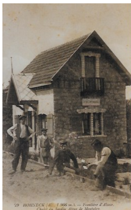
Figure 6 : le chalet portant la mention "station expérimentale".

Des expériences de génétique et d'amélioration de la pomme de terre de féculerie par l'altitude sont réalisées. C'est l'époque en effet où la fécule a d'importantes utilisations dans l'industrie. Le jardin prend une nouvelle orientation avec la plantation et l'expérimentation de plantes alimentaires, fourragères et médicinales alpines. L'étude des fourrages alpestres constitue un aspect important de l'activité dirigée par Gain avec le concours d'un vétérinaire militaire. La mise en place de ces extensions et améliorations et l'organisation des visites sont terminées en juillet 1914 : le 10 pour les visites et le 23 pour l'équipement du laboratoire 35 . La guerre va être déclarée dans un peu plus d'une semaine ! L'ensemble comprend à ce moment 700 à 800 espèces dont 200 espèces fourragères de la flore alpestre. Ces chiffres sont cités par Gain en 1921 36 . Des stations spéciales de certaines plantes, comme les edelweiss ou la clématite des Alpes ont été créées hors du jardin, à Falimont où le vent est très violent et à Frankenthal où la difficulté d'accès rend les cuillettes moins faciles. Ceci constitue une sorte de retour aux expérimentations des précurseurs vosgiens. Le jardin prend alors le nom de "Station expérimentale de l'institut agricole de l'université de Nancy" (figure 6), ce qui est bien pompeux, surtout quand on sait ce qui s'y passait du vivant du professeur Brunotte.