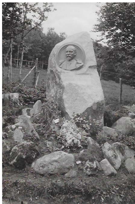
Figure 4 : le monument à Brunotte.