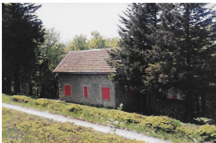
Figure 8 : l'ancien chalet du jardin en lisière de la forêt.

Sur place, le visiteur qui emprunte le chemin qui monte vers la forêt en passant près du bâtiment de l'ancienne ferme de Monthabey, non loin de la piste de ski, rencontre une petite maison qu'il prend certainement pour une maison de vacances banale (figure 8). Pour le promeneur qui sait, mais il y en a très peu, il s'agit de l'ancien chalet, celui qui avait été érigé sous la direction du professeur Gain et qui était ensuite devenu le chalet du Ski-club strasbourgeois. C'est, en ce début du XXI e siècle et un siècle après la Grande Guerre, le seul vestige, anonyme mais sur place, de ce que fut le jardin de Monthabey... C'est peu et pourtant c'est beaucoup pour le botaniste qui passe par là et qui sait ce que rappellent ces murs !