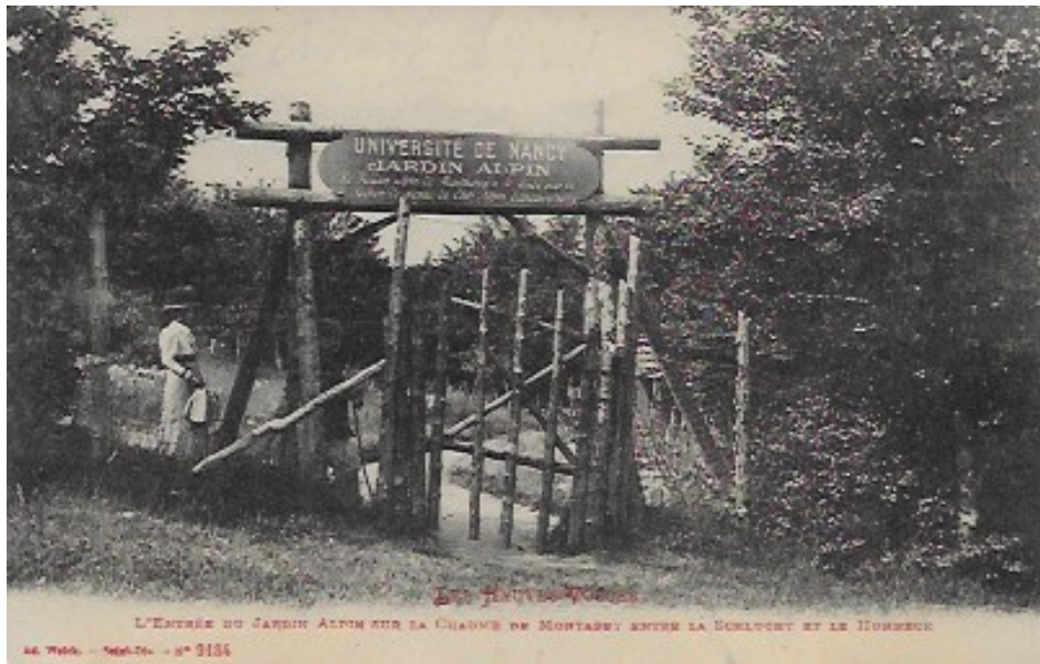
Figure 1 : la porte du jardin et la clôture. Carte postale ancienne, collection P. Labrude.

entouré par une simple barrière de bois, assez élevée pour que les animaux ne puissent pas pénétrer trop aisément et dévaster les plantations. Sa porte mentionne son appartenance comme le montrent les cartes postales de l'époque (figure 1).