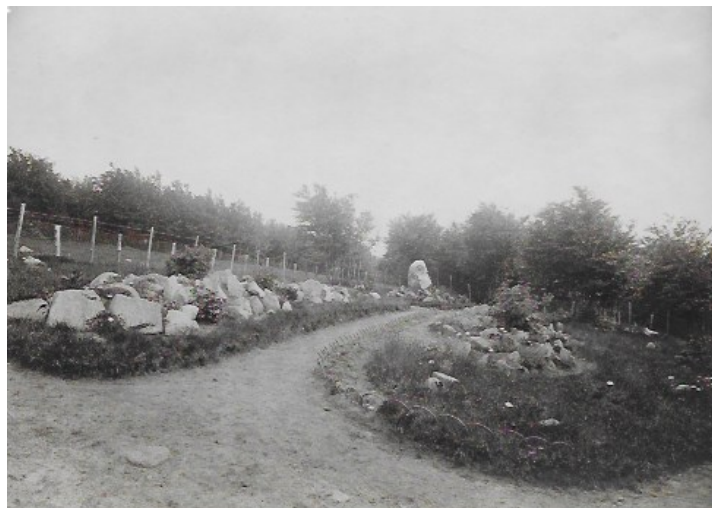
Figure 5 : les massifs de la partie gauche du jardin et le monument.