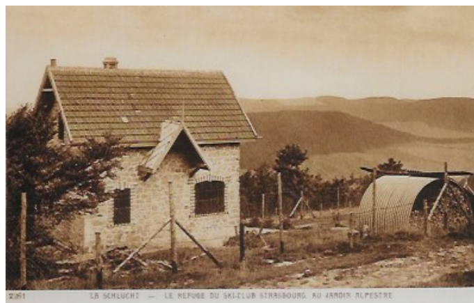
Figure 7 : le jardin et le chalet à l'époque du club de ski strasbourgeois. Carte postale ancienne