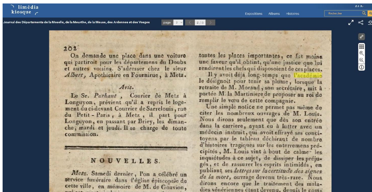
Le site LIMEDIA-KIOSQUE

connexions ont rendu nécessaire d'améliorer le moteur, dont une nouvelle version a été installée dès 2021.