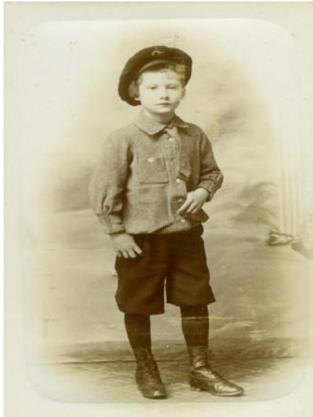
L'enfance à Épinal