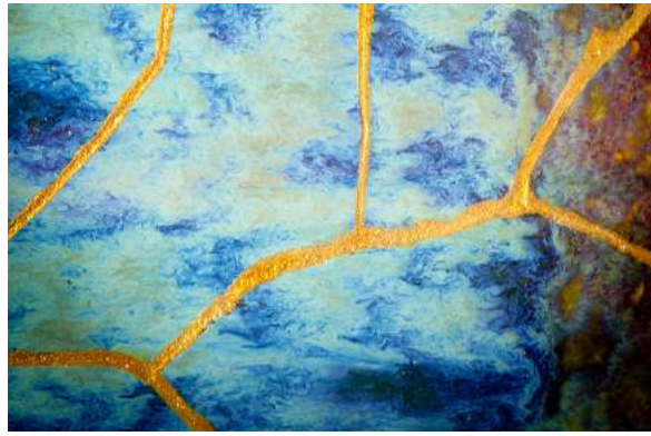
Le kintsugi, métaphore de la résilience