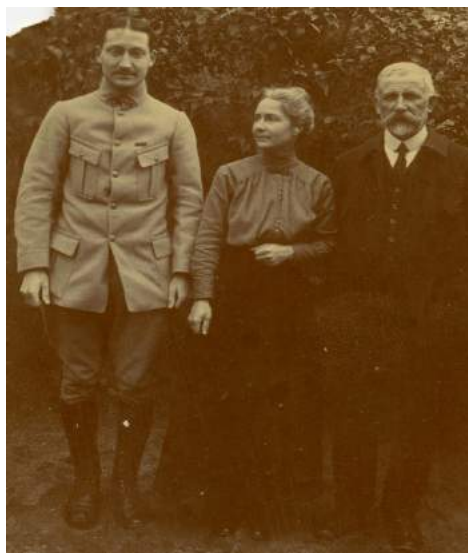
Le jeune soldat avec ses parents lors d'une permission

La place privilégiée de la mère est une constante, comme l'exprime avec tendresse Antoine de Saint-Exupéry 5 : « Vous ne pouvez pas bien savoir cette immense gratitude que j'ai pour vous, ni quelle maison de souvenirs vous m'avez faite... Et ce monde de souvenirs d'enfants, de notre langage et des jeux que nous inventions me semblera toujours désespérément plus vrai que l'autre... »