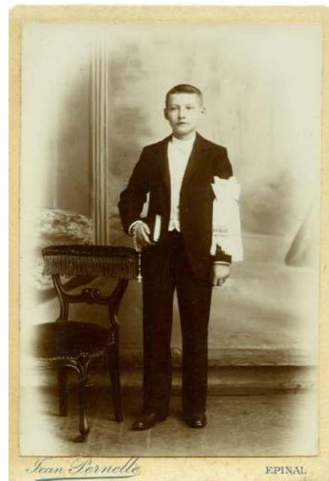
La communion à Châtel

À cette époque, on pensait que l'enfant devait être corrigé, que cela en faisait un adulte solide, endurci, prêt à vivre les difficultés de l'existence, prêt à devenir un soldat dont on avait grand besoin pour défendre la patrie. Mais la résilience n'a rien à voir avec la résignation.