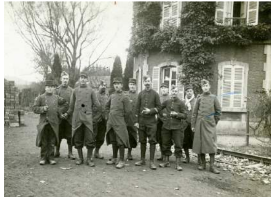
À droite, le jeune soldat et ses camarades du régiment d'infanterie

Le jeune homme évoque dans cette exceptionnelle correspondance ce qui l'aide à tenir : l'attachement à ses parents, les rencontres, le groupe, la capacité de donner un sens et une cohérence, une gamme d'aptitudes et de compétences, la volonté, l'humour, la religion, la chance, la projection dans l'avenir, autrement dit les différents domaines qui constituent la résilience. Les extraits de lettres choisis pour cette étude cherchent à mettre en évidence les facteurs de résilience du jeune soldat au fil des événements et à « meubler » sa casita . Associés à des paroles d'auteurs, d'écrivains, de témoins ou de survivants de situations extrêmes, de préférence dans d'autres circonstances que la Première Guerre mondiale, ils enrichissent la compréhension de la résilience dans chaque domaine évoqué.