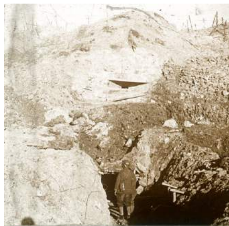
Fort de Douaumont, entrée bombardée

Le 15 août 1918 : « Je devais être prêt à sept heures et j'ai fait des pansements jusqu'à dix heures. L'hôpital manque beaucoup de personnel et mon infirmière a pensé que je ne serais pas déplacé dans une salle d'opération. Elle a soumis son idée au docteur qui s'est montré charmant et, chaque matin, j'endosse la grande blouse et le tablier et je vois des choses fort intéressantes... »