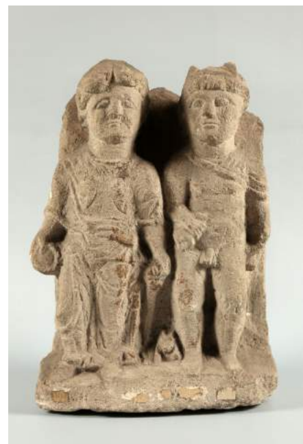
Stèle de Mercure et Rosmerta Musée de La Cour d'Or - Metz Métropole (Inv.2012.0.99)