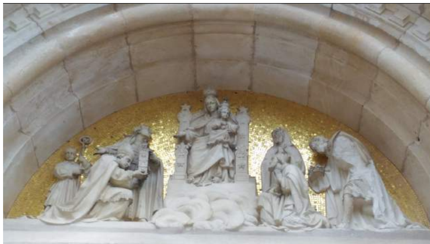
Fronton de la façade de la basilique Notre-Dame de Sion

Une statue géante en fonte de fer représentant la Vierge Marie y est hissée en 1871, après un échec en 1870. Son allure a un sens politique, puisqu'elle est dos à la Prusse et a les bras tendus vers Toul. Elle mesure 7 mètres de haut et pèse 8 tonnes. Au-dessus du portail de la basilique, à la base de la tour, un beau tympan, sur fond de mosaïque d'or, résume l'histoire du pèlerinage : à droite, on voit l'évêque Saint Gérard, à genou devant le trône de la Vierge.