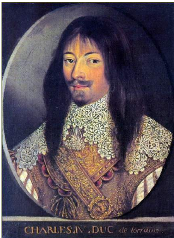
Charles IV (1604-1675) duc de Lorraine Huile sur toile, 4e quart du 17e siècle (Inv. 53.1.7)