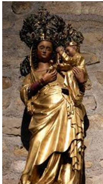
Vierge à l'alérion du XIV ème siècle placée dans l'abside en 1804

La cérémonie du 10 septembre n'était pas le simple couronnement d'une statue mariale... Elle devenait une manifestation patriotique d'une province meurtrie par le séjour prolongé de troupes adverses et par l'amputation de la Moselle, d'une partie de la Meurthe, des Vosges et de l'Alsace. Et les catholiques des quatre diocèses lorrains déposèrent dans l'église, sur un autel, une croix de Lorraine brisée entourée d'une couronne d'immortelles, surmontée des mots en patois de Dieuze, zone annexée par le Reich : CE N'AME PO TOJO ( Ce n'est pas pour toujours ) en lettres d'or sur une plaque de marbre noir et encadrée de deux mots : ESPOIR et CONFIANCE et AVE MARIA . Pendant l'office, les bannières des paroisses de Moselle ou d'Alsace, telles Metz, Lixheim, Strasbourg, ou de Meurthe, comme Château-Salins, furent ornées de crêpe noir.