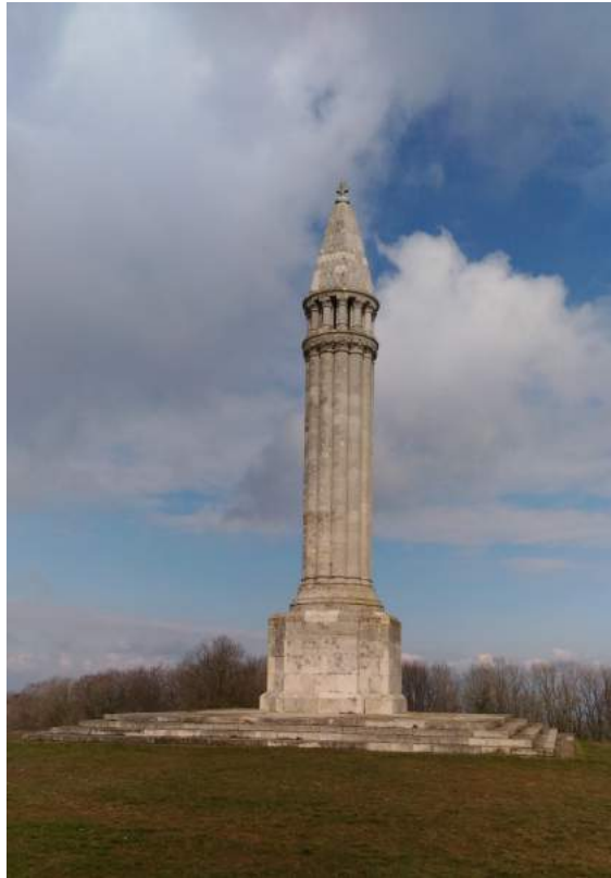
Installation du monument Barrès le 23 septembre 1928

Vierge de Sion, sauvez-moi ! Elle s'élança dans le ravin profond et son cheval tomba debout sur une large pierre où il fit une marque profonde de ses quatre fers. Au même moment, la Vierge saisit dans le ciel une poignée d'étoiles que la nuit tombante venait d'allumer et les jeta dans les yeux du cavalier et de sa monture qui, aveuglée, se cabra et tourna bride. C'est depuis ce soir là qu'on les retrouve par myriades dans le sol de la colline. En réalité, il s'agit d'Encrines ou lys de mer qui peuplaient le fond des océans il y a environ 200 millions d'années. Ces étoiles correspondent aux pièces composant la tige de ces animaux, en quelque sorte leur colonne vertébrale.