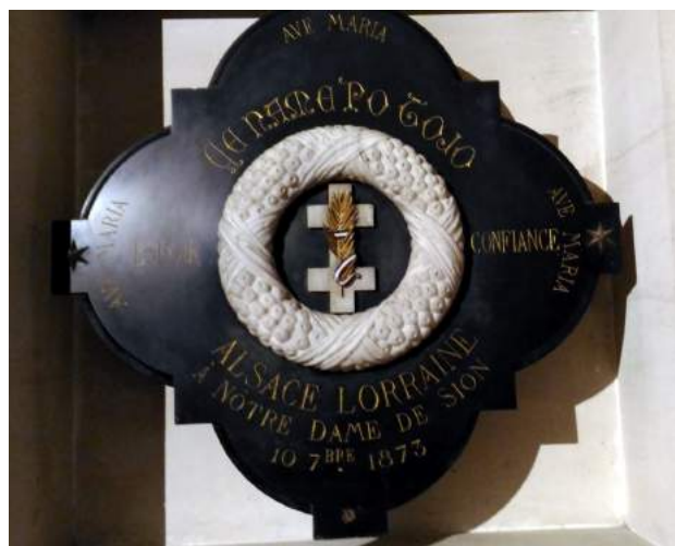
Ex-voto commémoratif de l'annexion de l'Alsace-Lorraine par l'Allemagne

C'est l'acte fondateur du mythe de la Colline inspirée (Parisse, 1977-39, Martino, 2009-37, Boquillon et al, 2010- 10 et 2019-11). Plus de 30.000 personnes, accompagnées de 1.500 prêtres et 6 évêques, prirent part à cette cérémonie mi-religieuse, mi-patriotique ; et 70.000 fidèles, dans la semaine qui a suivi, vinrent sur la colline. Ce premier Po Tojo eut pour conséquence, en dehors de la relance des pèlerinages de masse et du culte marial en Lorraine, de donner une dimension nationale et politique à l'église de Sion. L'esprit de Revanche s'épanouit sur la Colline, d'où l'on devinait dans l'horizon la Moselle annexée, où se déroulaient bien des cérémonies d'anciens combattants et où régnait le romantisme patriotique de Barrès.