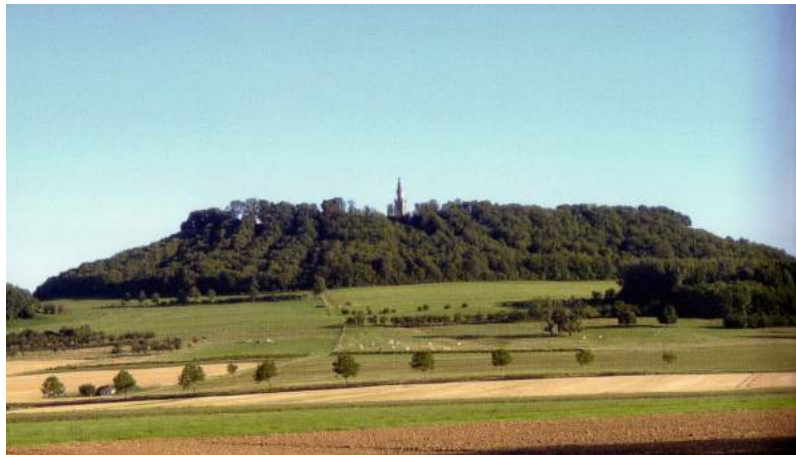
La colline de Sion surmontée de la statue de la Vierge