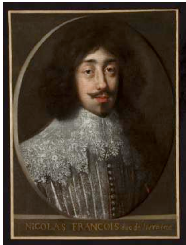
Nicolas-François (1609-1670), duc de Lorraine Huile sur toile, 4e quart du 17e siècle (Inv. 53.1.10)