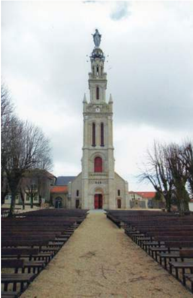
Façade et tour de la basilique Notre-Dame de Sion