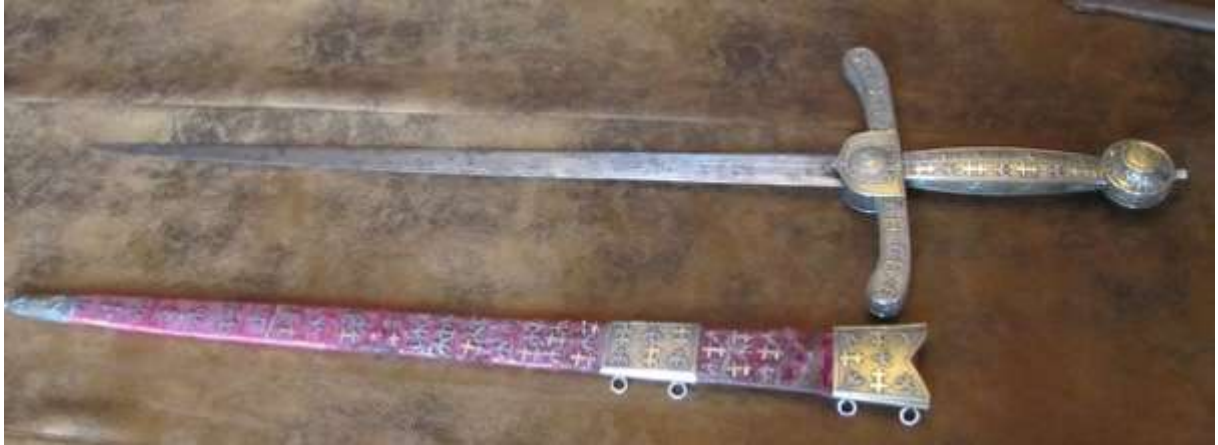
L'épée d'Haroué et son fourreau.