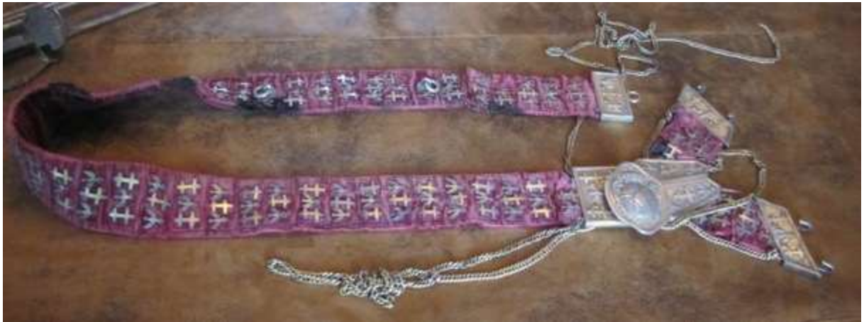
Le baudrier de l'épée d'Haroué.