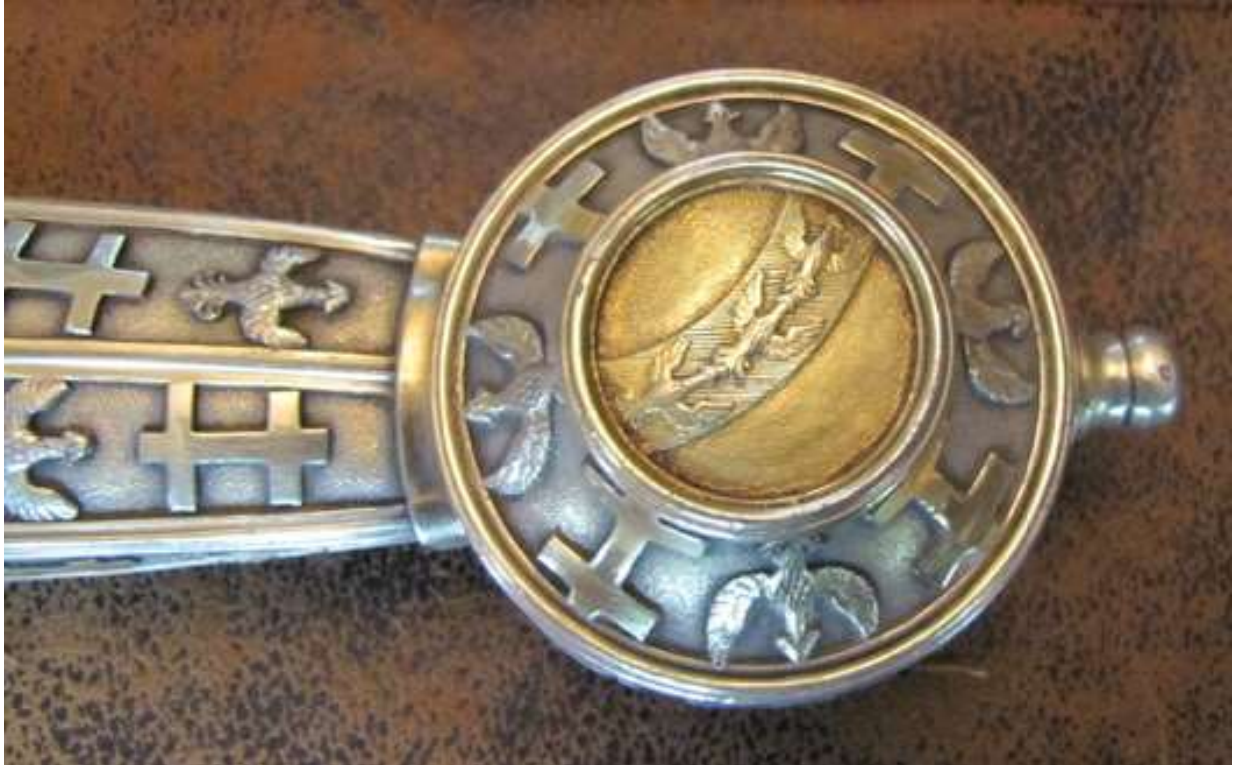
Le pommeau de l'épée d'Haroué. © Photographie François Le Tacon, Haroué 2012.