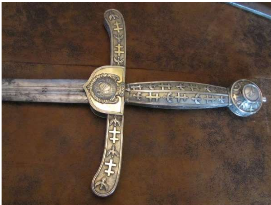
La garde de l'épée d'Haroué. © Photographie François Le Tacon, Haroué 2012.