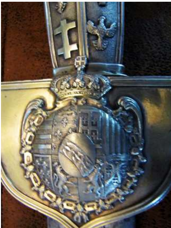
Le talon de l'épée en vermeil et en forme d'écu avec les armes de la maison de Lorraine entourées du collier de chevalier de l'ordre Habsbourgeois de la Toison d'or et surmontées de la couronne ducale.