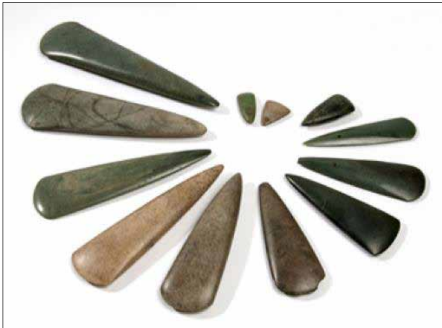
Haches polies d'apparat en jadéite provenant du Tumulus Saint-Michel. Musée de Carnac.