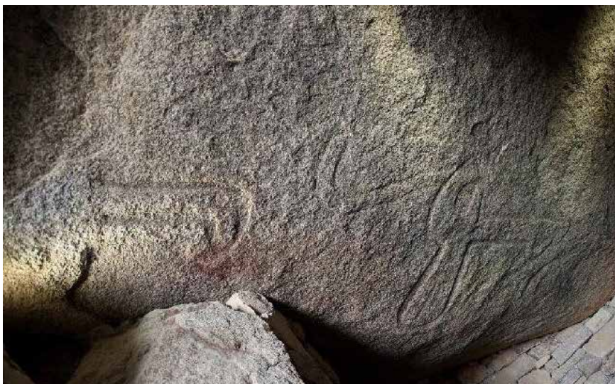
Gravures à l'intérieur de la Table des Marchands