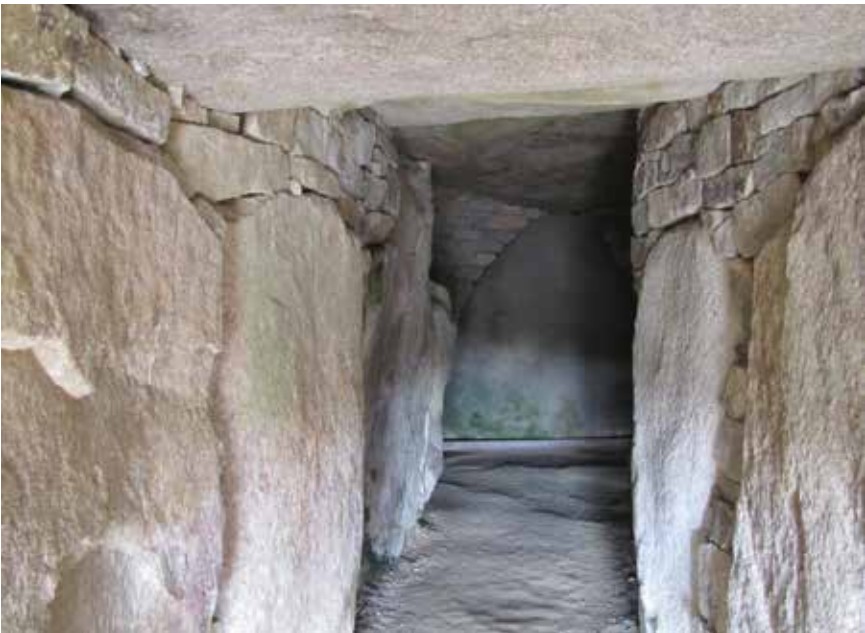
L'intérieur de la Table des Marchands

Avant de décrire La Table des Marchands, nous allons nous pencher sur l'origine de ce nom. La première mention est celle de Maudet de Penhouët en 1814 qui propose le nom de Dolmarchand, une transcription française erronée de l'appellation locale Dol Ar Marc'hand, Dol ou plus exactement Taol voulant dire table en breton et Marc'han petit cheval. En 1836, Prosper Mérimée, inspecteur des monuments historiques, fait une transcription erronée de Dolmarchand. Il écrit pour la première fois Table des Marchands , parfois ensuite appelée Table marchande . Mais c'est Table des Marchands qui va s'imposer. Zacharie Le Rouzic et Charles Keller publient conjointement un article sur la Table des marchands et le dolmen de Mané-Er H'Roëek dont il y aura trois éditions, la dernière en 1936. Ce dolmen était à l'origine une chambre funéraire de 2,5m sous plafond à laquelle on accédait par un couloir de 7 mètres. Le tout était recouvert par un cairn maintenant reconstitué.