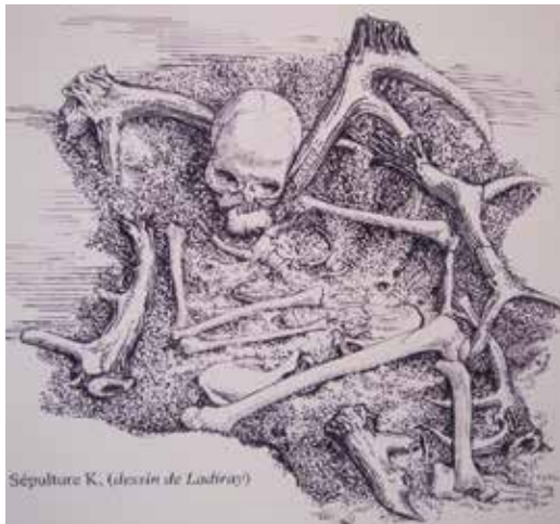
Un squelette de la sépulture K de Téviec. Dessin de Ladiray D'après Péquart M., Péquart S.-J., Boule M., Valois H., 1937

Les squelettes de Téviec sont toujours à la disposition des chercheurs qui continuent à les étudier. Presque tous ces hommes ou femmes sont décédés de mort violente, provoquée par des armes, d'où l'hypothèse avancée par certains d'un massacre perpétué par des groupes concurrents. Nous allons nous intéresser plus particulièrement aux deux squelettes de la sépulture A de Téviec, conservés à Toulouse et reconstituée en 1938 par Philippe Lacombe. Contrairement à ce que l'on pensait jusqu'à présent, l'ADN a parlé. Il s'agit bien de deux femmes âgées de 25 à 30 ans et non d'un homme et d'une femme. Elles sont parées de colliers de coquillage, de bracelets et d'anneaux de jambes, le corps en partie recouvert de bois de cervidés. Le mobilier funéraire est riche en silex. Cette tombe a été étudiée par 30 chercheurs dont deux médecins légistes. Le crâne de la femme de gauche présente cinq impacts dont l'un, situé entre les deux yeux, semble résulter d'une blessure par flèche ou par sagaie. Le crâne de droite présente deux traces de coup. Les neuf squelettes de l'Institut de Paléontologie humaine de Paris sont actuellement en cours d'études.