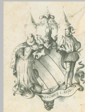
Ex-libris L. Benoît AFCEL