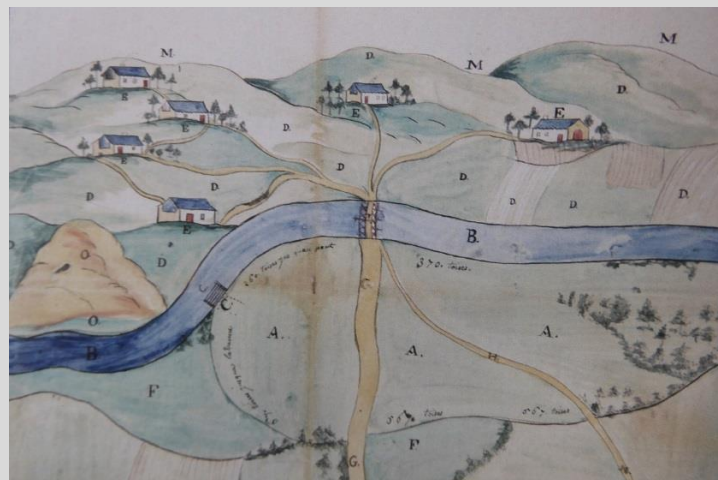
Représentation des Vosges en montagne bleue (1769). En fait, plan autorisant la création de nouvelles prairies irriguées sur le ban de Longchamp