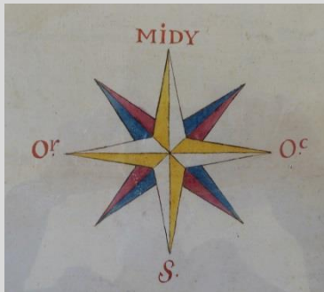
Rose des vents à huit pointes et quatre couleurs, avec le Septentrion (S) en bas Arch. dép. de Meurthe-et-Moselle, 1 Fi 614