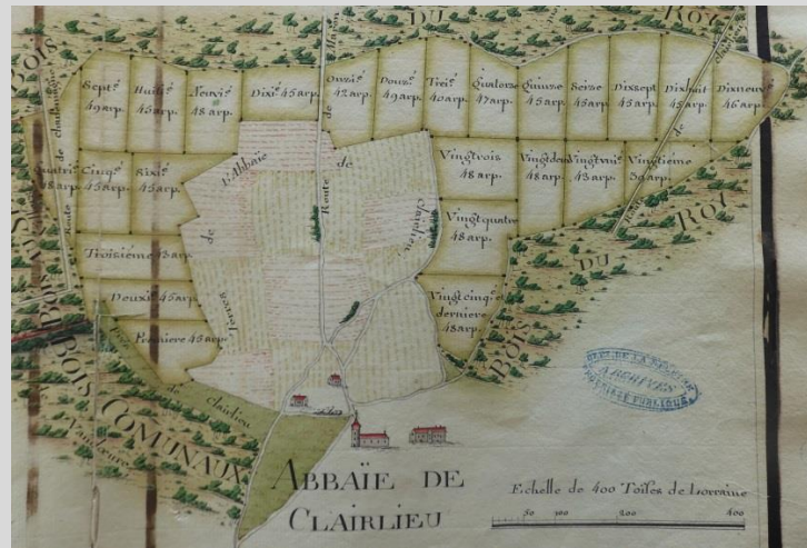
Plan de l'abbaye cistercienne de Clairlieu (1768) et des bois attenants où s'applique la Réformation Arch. dép. de Meurthe-et-Moselle, H 48