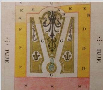
Plan du jardin des Dames de la Visitation en 1755 (nous sommes à proximité immédiate de l'emplacement du siège de l'Académie) Nancy, bibliothèque Stanislas, M-PI-AL 00002-185