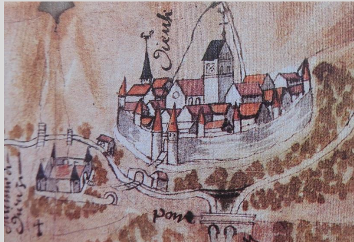
Dieux et sa saline cerclées de fortifications en 1628