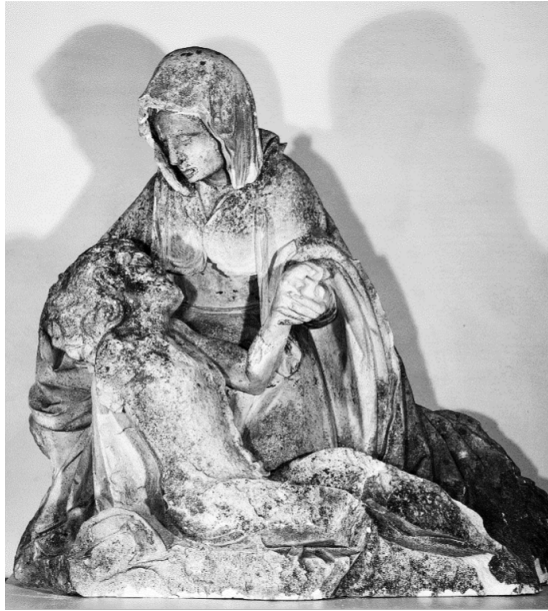
Figure 7 ▶ Vierge de pitié de Neufchâteau, vers 1530.

sculptés en ronde-bosse, ou sur le fût des calvaires; de même une cinquantaine de Vierge de pitié, et de nombreux retables. Il est même assez probable que la Vierge de pitié de Neufchâteau, récemment découverte et inscrite monument historique, provienne de l'église des Cordeliers : nous datons cette statue des années 1530 et l'attribuons à un imagier lorrain contemporain de Ligier Richier. Exceptionnellement, en effet, le Christ est assis à terre, soutenu par la Vierge, qui s'agenouille dans sa déploration, et le visage du Fils est tourné vers sa mère 5 (voir figure 7).