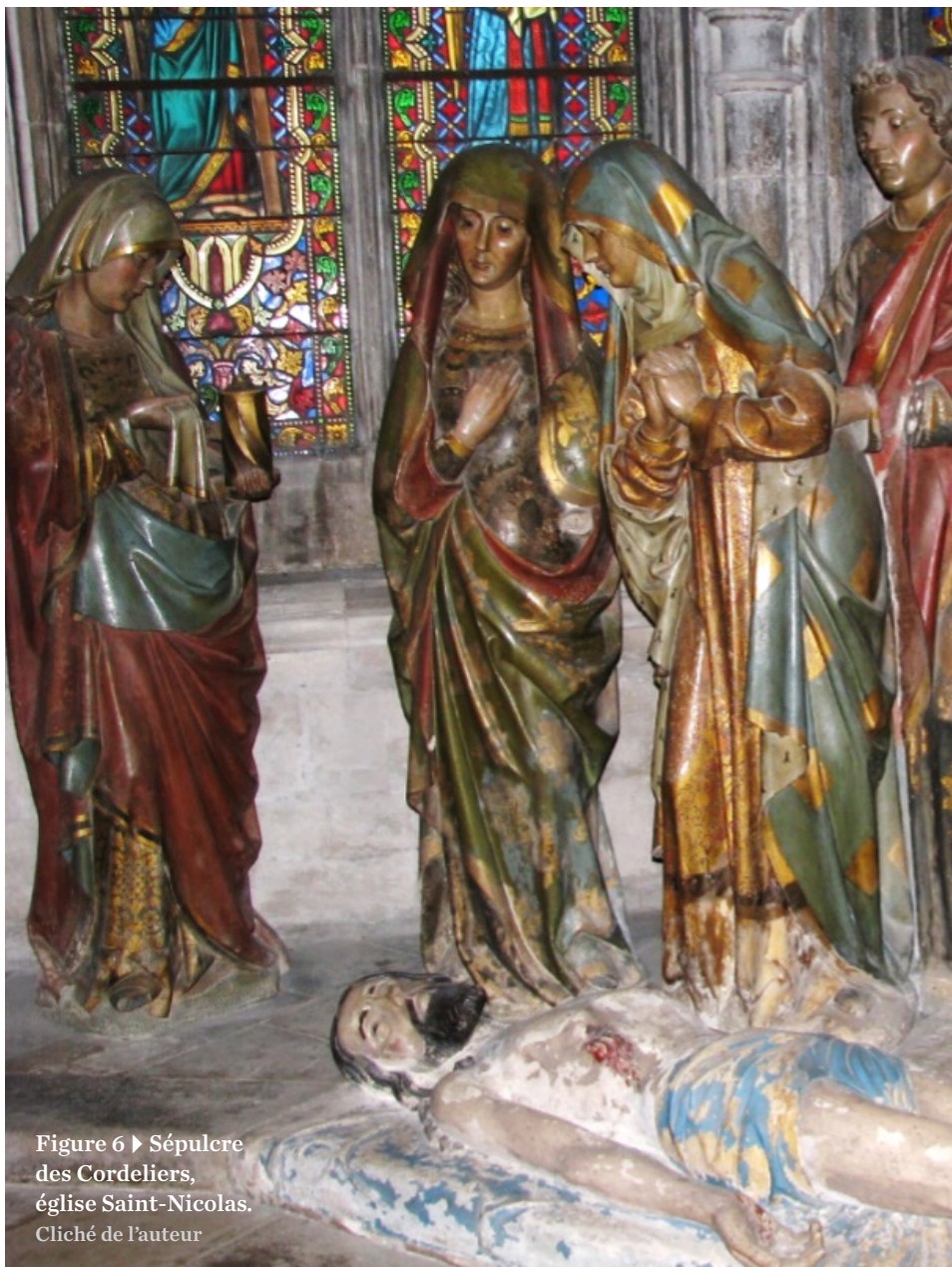
Figure 6 ▶ Sépulcre des Cordeliers, église Saint-Nicolas. Cliché de l'auteur