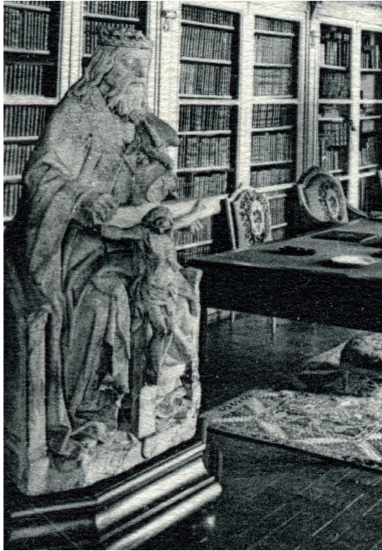
Figure 3 ▶ Détail d'une carte postale ancienne de la bibliothèque du château de Brienne, éditée vers 1930.

Des statues de saint François et de saint Bonaventure, provenant du couvent, étaient encore présentes à Neufchâteau vers 1860, d'après les descriptions de l'érudit Iverneau, mais ont depuis disparu. Nous avons retrouvé la trace de l'importante statue du Trône de Grâce provenant des Cordeliers : achetée après 1860 par les Bauffremont pour orner la bibliothèque de leur château de Brienne (voir figure 3), elle a été revendue en 1933 et n'est malheureusement plus localisée. Cette statue de la fin du XV e siècle-début du XVI e siècle témoignait remarquablement de la dévotion à la Trinité en Lorraine méridionale, ainsi que de la qualité des sculpteurs locaux.