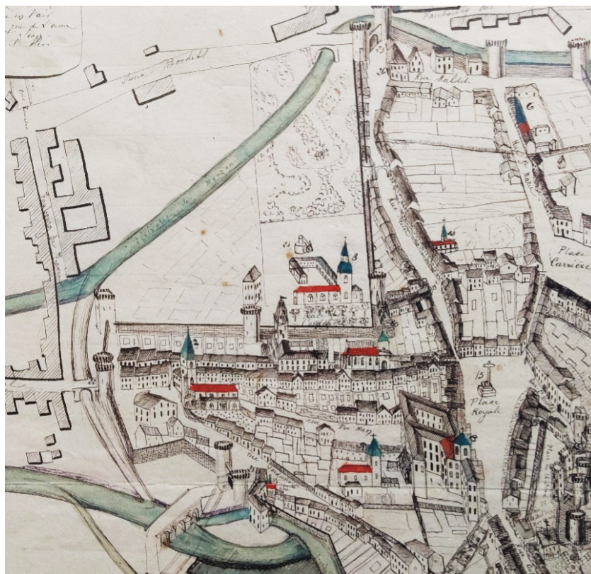
Figure 1 ► Plan dessiné en 1850 par Feunette, professeur au collège. Le couvent des cordeliers est au centre de la photographie, extra-muros , dans l'angle droit formé par les remparts.

vers un bras du Mouzon qui ceinturerait alors la cité et contribuait à la défendre. Hors du périmètre urbain exigu et saturé, le couvent s'aligne sur le tracé nord et ouest des remparts urbains, ce qui permet de créer une place entre le rempart et le flanc sud de la nouvelle église. Cette place, anciennement fossés de la ville, est d'accès contrôlé, par des portes et deux étroites ruelles. Elle est commune aux frères et aux bourgeois, et rien n'y doit