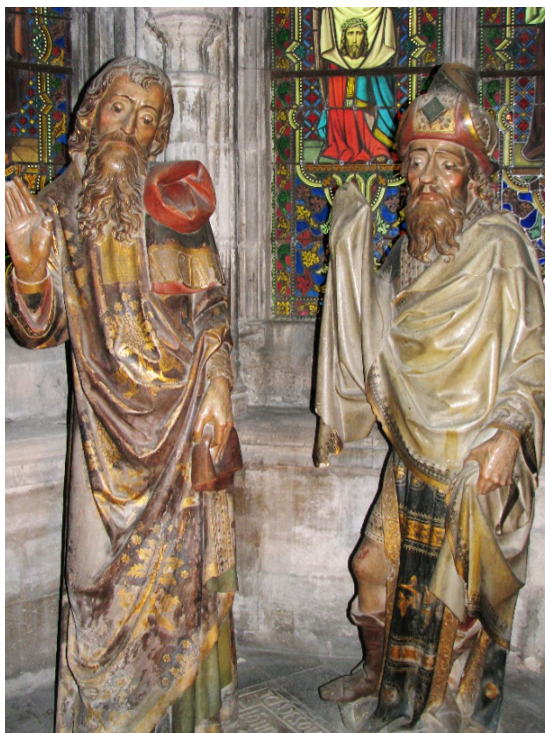
Figure 5 ► Nicodème et Joseph d'Arimathie, les deux juifs pieux.

ressée des fidèles, croyant acheter leur Salut. Le texte latin de l'indulgence commence par rappeler la Résurrection : Christus resurgens ex mortuis non moritur ; et il engage les fidèles à aller voir en nombre et fréquemment, honorer et vénérer « l'autel ou bien le Sépulcre du corps du Christ ». La pierre de l'onction prend donc valeur d'autel, le corps qui y est posé préfigurant le « sacrifice » de la messe. C'est une démarche de pénitence qui conduisait les fidèles à venir écouter une prédication des frères, se confesser, donner de l'argent, puis à se rendre devant ce Sépulcre, les vendredis soir « pour y réciter dévotement cinq Pater et cinq Ave, ou tout autre jour entre les premières et les