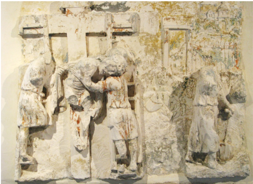
Figure 4 ► Fragment du retable des cordeliers, vers 1520. Coll. de l'auteur