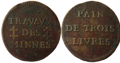
Figure 1. Méreau des mines d'argent de Vosges. Dominique Flon

de Vosges quand il en fit rouvrir l'exploitation en 1721 pour une très brève période. Ils ouvrent droit, entre autres, à un pain de trois livres, à une livre de viande fraîche ou crue ou à une chopine de bouillon ( voir figure 1 ). Ces rarismes méreaux sont les précurseurs des bons d'économat.