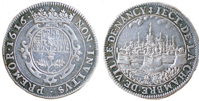
Figure 2. Jeton de la ville de Nancy, 1616. Dominique Flon

Voici le jeton de la ville forgé en 1616, dont le revers présente une vue de la ville vieille défendue par trois bastions à échauguettes. On remarquera le soin porté à l'image où on reconnaît, par exemple, sur la droite les deux tours de la porte de la Craffe (voir figure 2).