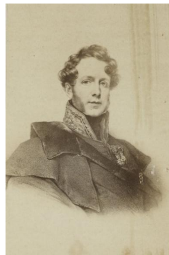
Jacques Boucher de Perthes.